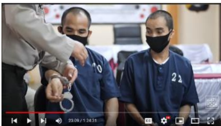
Gambar 4. Polisi Tangkap Masyarakat Adat Penyang Atas Tuduhan Pencurian Kelapa Sawit

Dalam teks dialog Dedi Susanto, staf Desa Penyang, memuat adanya ketimpangan kekuasaan antara masyarakat