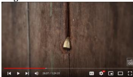
Gambar 5. Peluru Bekas Tembakan dari Serangan Aparat Masih Menempel di Dinding Kayu Rumah Warga

Narator film menyebutkan “ desa diserbu aparat keamanan ” yang menunjukkan adanya konflik yang menimbulkan ketegangan antara Desa Babual Baboti dengan pihak perusahaan. masyarakat Babual Baboti, Kecamatan Kotawaringin Lama, Kabupaten Kotawaringin Barat, Kalimantan Tengah berlangsung dengan perusahaan sawit PT Usaha Agro Indonesia, bagian dari grup Sampoerna Agro. Dalam dialog tokoh yaitu salah satu warga desa menjelaskan dengan menggunakan bahasa spontan dan informal, “ Saya lagi duduk di situ anak kan lagi rebahan di situ ” hal ini memberikan kesan otentik yang menciptakan kedekatan dengan penonton dengan peristiwa yang terjadi.