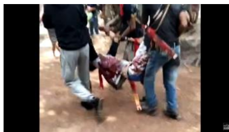
Gambar 3. Beberapa Warga yang Melakukan Aksi Mengangkat Gijik yang Ditembak Polisi dan Tewas Di Tempat

lama tanpa adanya solusi yang jelas. Hal ini menimbulkan ketidakpuasan warga terhadap kebijakan perusahaan. Kejadian ini menunjukkan imbas dari tidak berhasilnya mediasi yang harusnya bisa dilakukan oleh perusahaan yang menimbulkan kerugian bagi perusahaan dan juga masyarakat yang mengalami kekerasan fisik dari penembakan gas air mata.