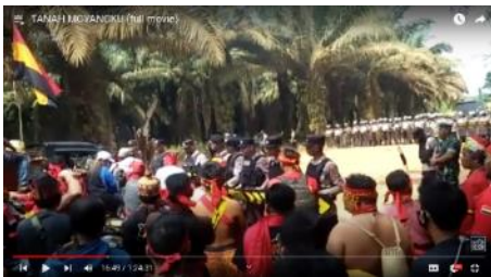
Gambar 2. Suasana Aksi Masa Warga Desa Bangkal

Sumber: aksi terjadi pada 16 September 2023 (Purwanto, 2024)